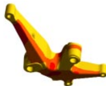
Bild 4: «Finite Element»-Analyse zur Visualisierung der am stärksten belasteten Bereiche (rot).

Um in der Fertigung die Prozesssicherheit zu gewährleisten, sind sämtliche teilespezifischen Informationen in den Arbeitspapieren vermerkt und begleiten den Kipphebel bei jedem Prozessschritt. Durch den grossen thermischen Modul der Kipphebel werden besondere Anforderungen an die Analyse