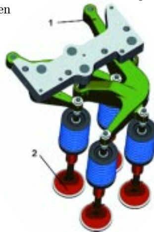
Bild 1: Funktionsprinzip der Kipphebel im MAN B&W Dieselmotor 48/60B (freie Formgebung ermöglicht ein Minimum an bewegten Teilen).