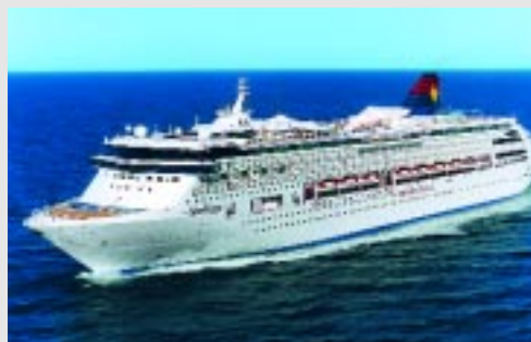
Die «SuperStar Virgo» ist 268 Meter lang und kann 1960 Passagiere aufnehmen. Ein schwimmender Palast – ausgerüstet mit Kipphebeln aus dem Hause von Roll casting. Le «SuperStar Virgo» mesure 268 mètres de long et peut accueillir 1960 passagers. Un palais flottant, équipé de culbuteurs de soupapes de la maison vonRoll casting.

dem die Yacht eine Spitzengeschwindigkeit von 70 Knoten erreicht (130 km/h).